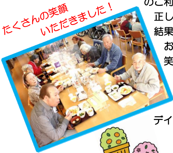
たくさんの笑顔いただきました!

おやつは桜餅と日本茶で桃の節句を堪能していただき笑顔あふれる楽しいひなまつりとなりました。