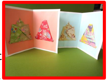
折り紙で作成したお雛様&お内裏様

寒さの中で有りながら、少しずつ春の陽ざしが感じられるようになったこの頃、なかとみロイヤルの園では3月2日(土) ひなまつりを行いました。ご利用者様の各席に折り紙で作成したお雛様とお内裏様のしおりを飾りました。皆様手にとって眺めて楽しんでいました。