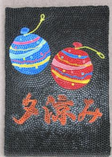
夕涼み会をイメージして作成しました。