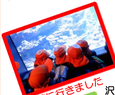
水族館に行きました