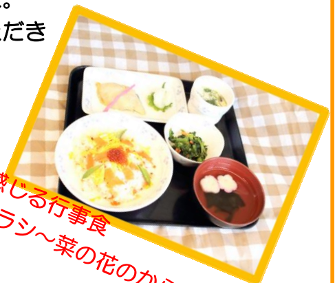
春を感じる行事食 海鮮ちらし～菜の花のからし和え